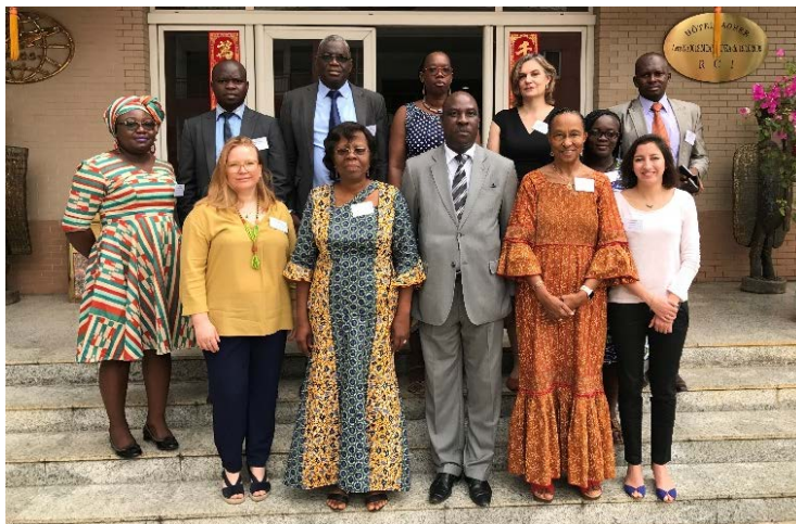
Consortium AFREENET – 27-28 mars 2018, à Abidjan (Côte d'Ivoire)

https://www.pasteur.fr/en/institut-pasteur/institut-pasteur-throughout-world/news/project-strengthen-national-ethics-committees-francophone-africa